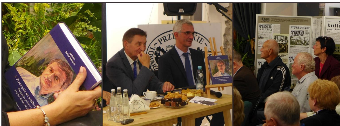
Promocja biografii Marszałka Marka Kuchcińskiego

- 30 października 2023 – Zamek w Kraszynie - promocja tomu z cyklu Biblioteka Przemyskiego Towarzystwa Kulturalnego, polskiego tłumaczenia poezji Gézy Gyóniego pt. Na polskich polach, przy obozowym ognisku . Promocja publikacji była połączona z uroczystym wręczeniem odznaczeń państwowych i resortowych zasłużonym dla kultury.