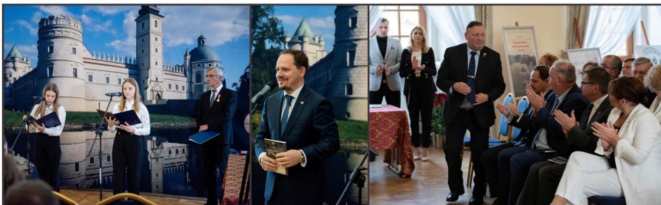
Promocja poezji Gézy Gyóniego „Na polskich polach, przy obozowym ognisku 1914-1915”