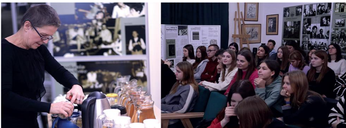
Warsztaty „Ziołolecznictwo w kuchni - kwiaty jadalne”