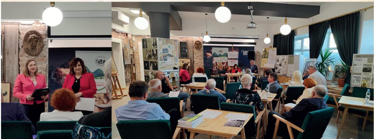
Spotkanie inauguracyjne Uniwersytetu Ludowego Europy Karpat