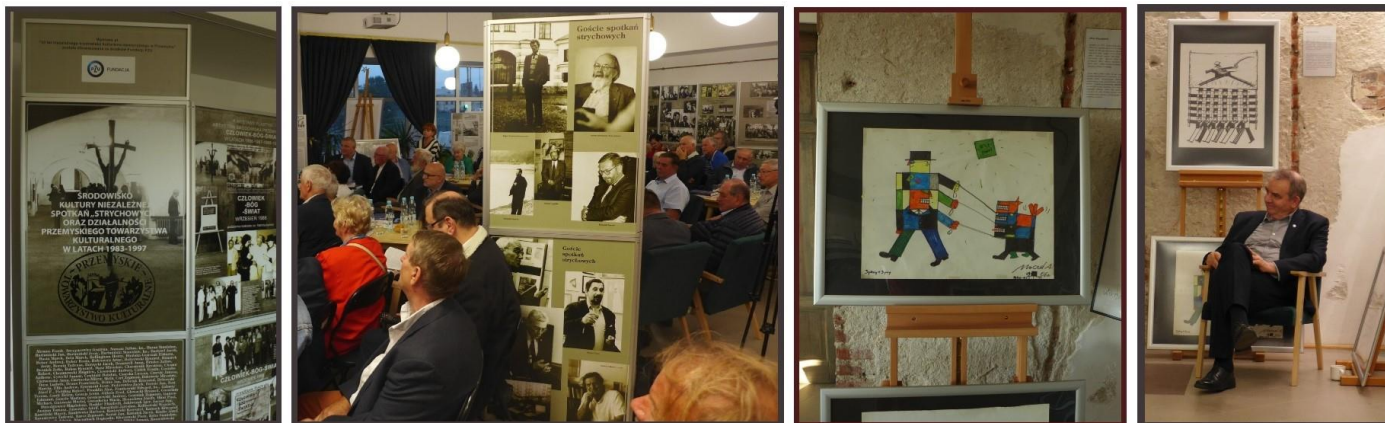
Wernisaż wystawy „40 lat środowiska kulturalno-opozycyjnego w Przemyślu”

- 5-10 listopada 2023 - Dni Kultury Chrześcijańskiej (współorganizowane z Centrum Kulturalnym w Przemyślu, Muzeum Archidiecezjalnym w Przemyślu i Galerią Sztuki Współczesnej w Przemyślu). W programie: