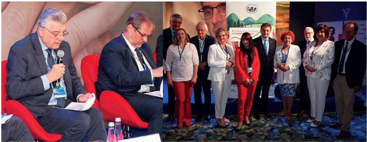
Seminarium naukowe o uniwersytetach ludowych podczas 36. Międzynarodowej konferencji Europa Karpat w Karpaczu