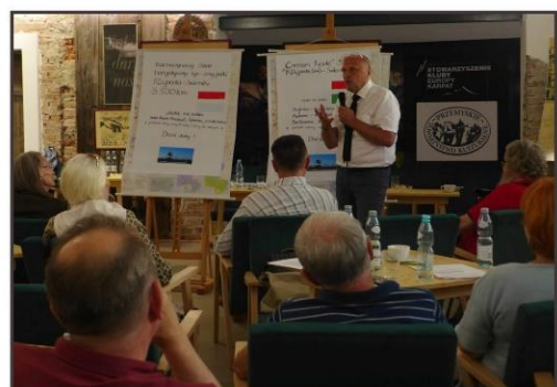
Konferencje z cyklu spotkań „Wydarzenia i ludzie Europy Karpat”