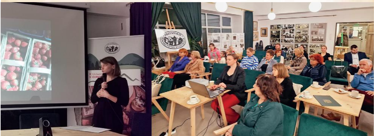
Seminarium pt. „Innowacyjność Kobiet Europy Karpat w nauce, biznesie i samorządzie”