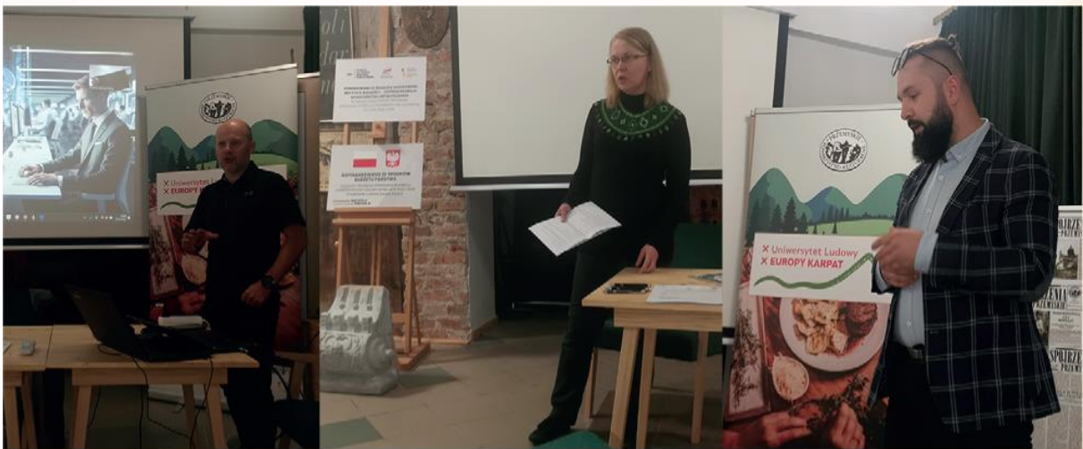
Szkolenie kompetencyjne dla członków Przemyskiego Towarzystwa Kulturalnego oraz kadry Uniwersytetu Ludowego Europy Karpat