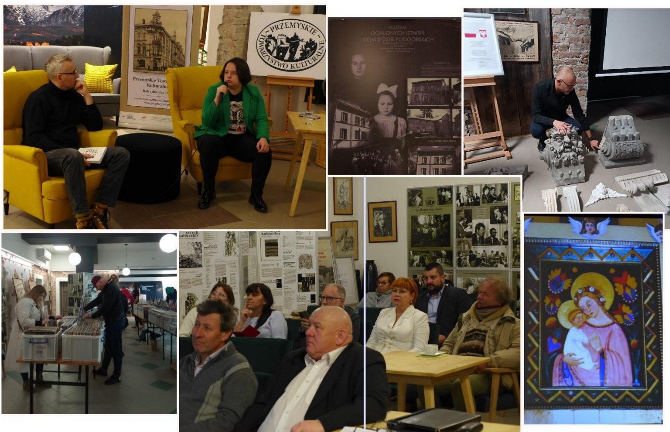
Spotkania Klubu Dyskusyjnego PTK