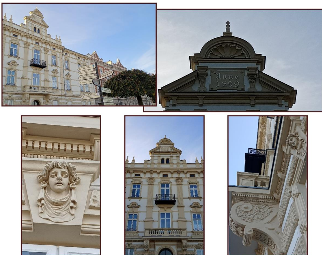
Siedziba PTK, odrestaurowana w 2023 roku

Ponadto, będą kontynuowane działania w ramach Uniwersytetu Ludowego Europy Karpat - szczegóły działań Uniwersytetu w osobnym załączniku.