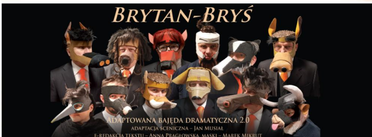
Kurs teatralny. Spektakl jednej z ostatnich komedii Aleksandra Fredry „Brytan Bryś”(1867)