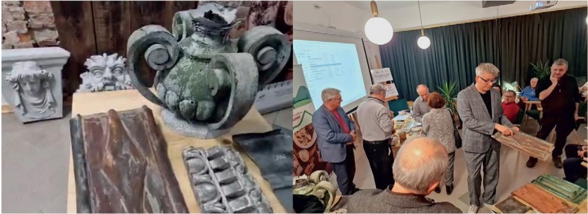
Warsztaty z ochrony dziedzictwa kulturowego