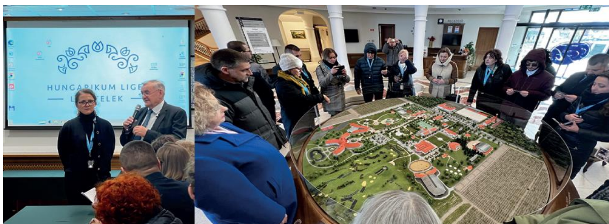
Wyjazd studyjny do Uniwersytetu Ludowego na Węgrzech

W 2024 roku Uniwersytet Ludowy Europy Karpat planuje organizację kolejnych wydarzeń (kurs fotograficzny oraz kulinarny, szkolenia, warsztaty, spotkania, wyjazdy studyjne, wydawnictwa). Udział w nich jest bezpłatny, co stanowi świetną okazję do samorozwoju, podnoszenia swoich kompetencji i zdobycia nowej wiedzy, spędzenia czasu w miłej i przyjaznej atmosferze.