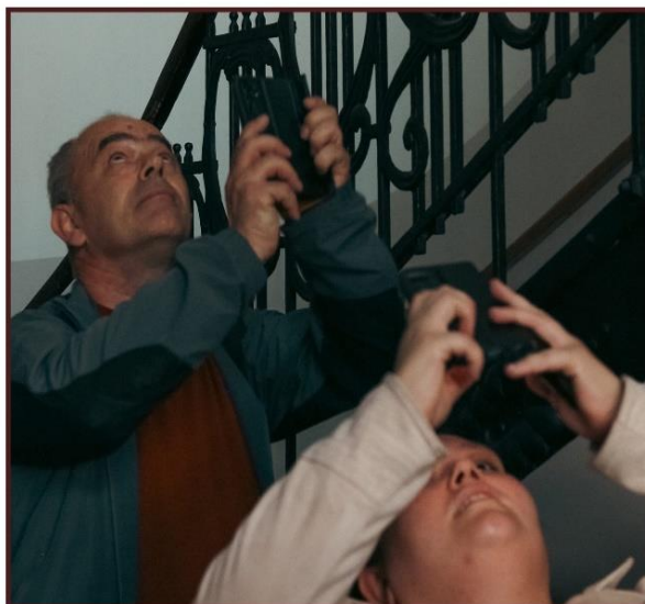
Spacer fotograficzny po Przemysłu