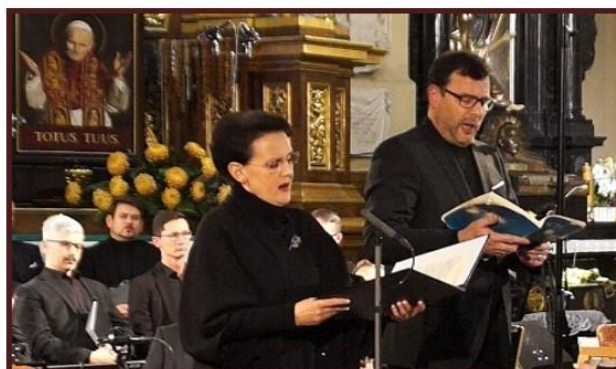
Dni Kultury Chrześcijańskiej