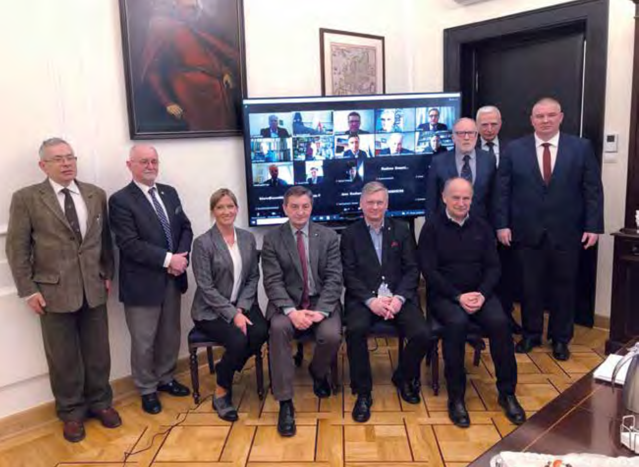
Spotkanie inicjujące działalność Międzynarodowych Klubów Europy Karpat, Warszawa, 5 kwietnia, 2022 r.