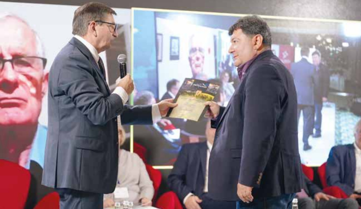
Posiedzenie Rady Programowej Klubów Europy Karpat, Karpacz, 6 września 2022 r.