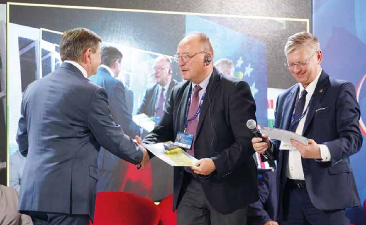
Posiedzenie Rady Programowej Klubów Europy Karpat, Karpacz, 6 września 2022 r.