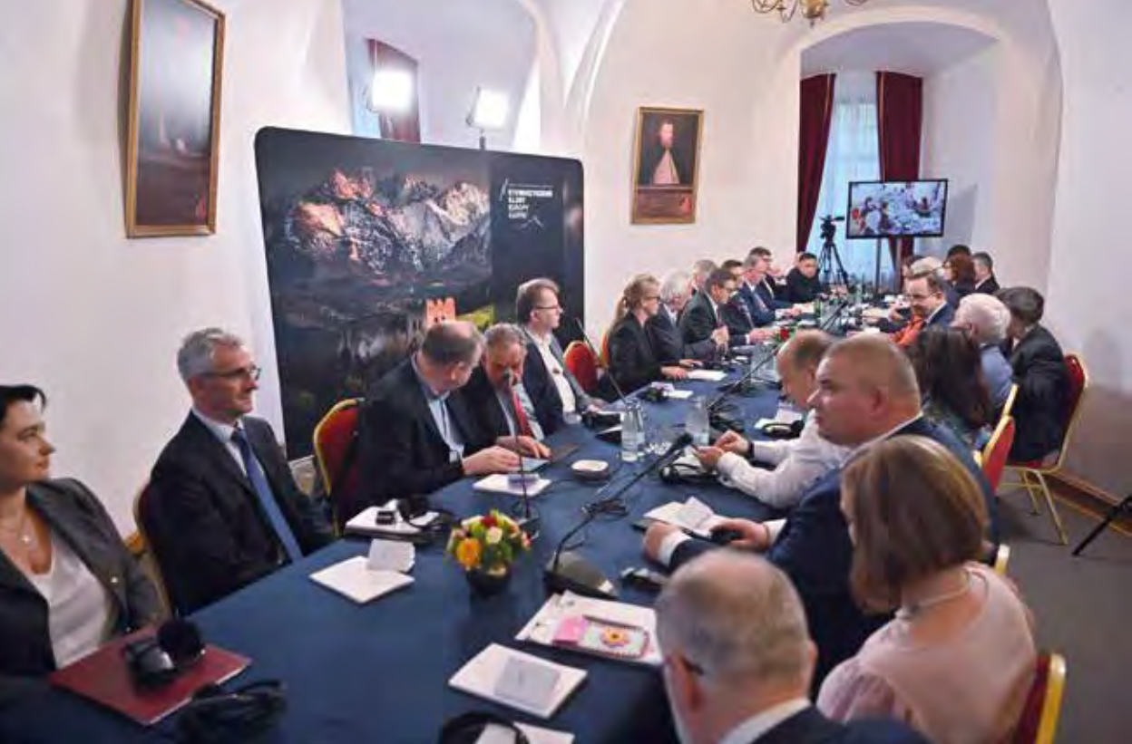
Spotkanie Stowarzyszenia „Kluby Europy Karpat”, Krasiczyn, 13 maja 2022 r.

wypracowania wspólnej strategii dla Karpat, która wykorzystując atuty tego obszaru, pozwoliłaby przezwyciężyć jego słabości.