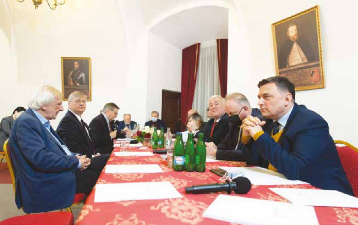
Spotkanie Stowarzyszenia „Kluby Europy Karpat”, Krasiczyn, 4 lutego 2022 r.