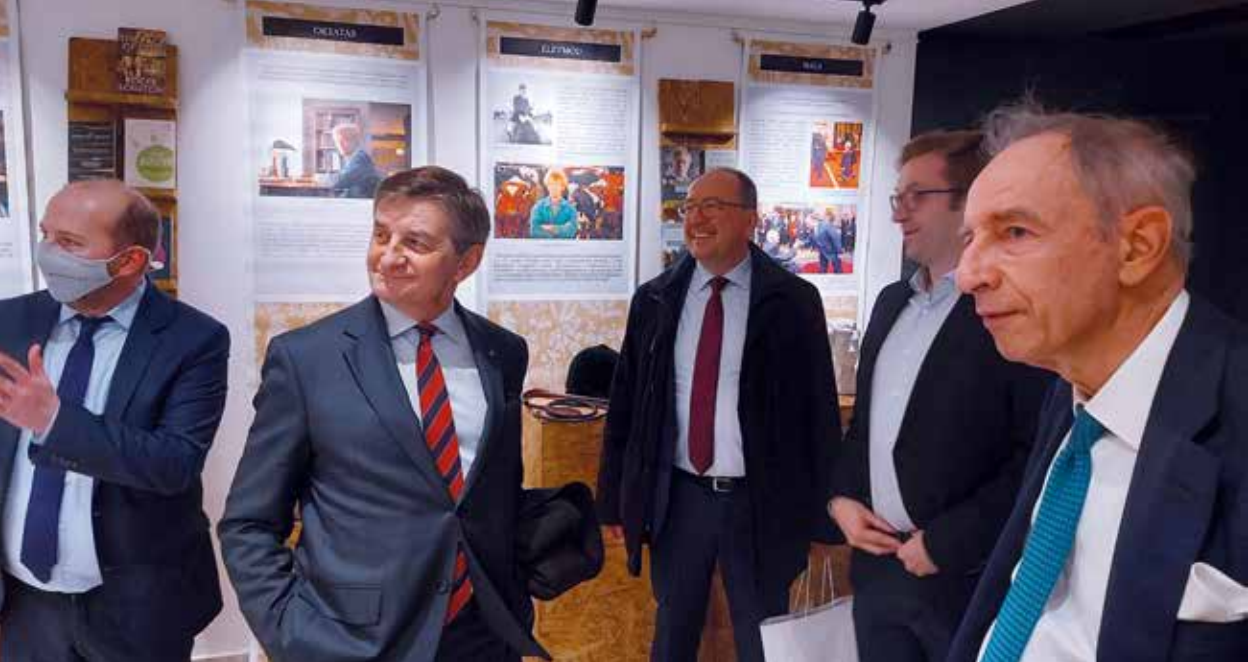
Spotkanie w Scruton Cafe, Budapeszt, 18 lutego 2022 r.

Zachęcamy rządy i samorządy krajów karpackich do podjęcia takich inicjatyw. Mogłyby one stanowić rodzaj „projektów pilotażowych” dla przyszłej makroregionalnej Strategii Karpackiej Unii Europejskiej.