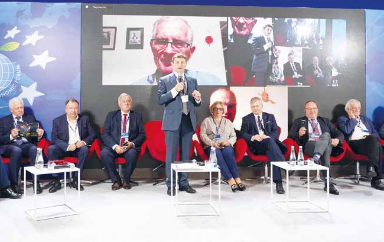
Posiedzenie Rady Programowej Klubów Europy Karpat, Karpacz, 6 września 2022 r.