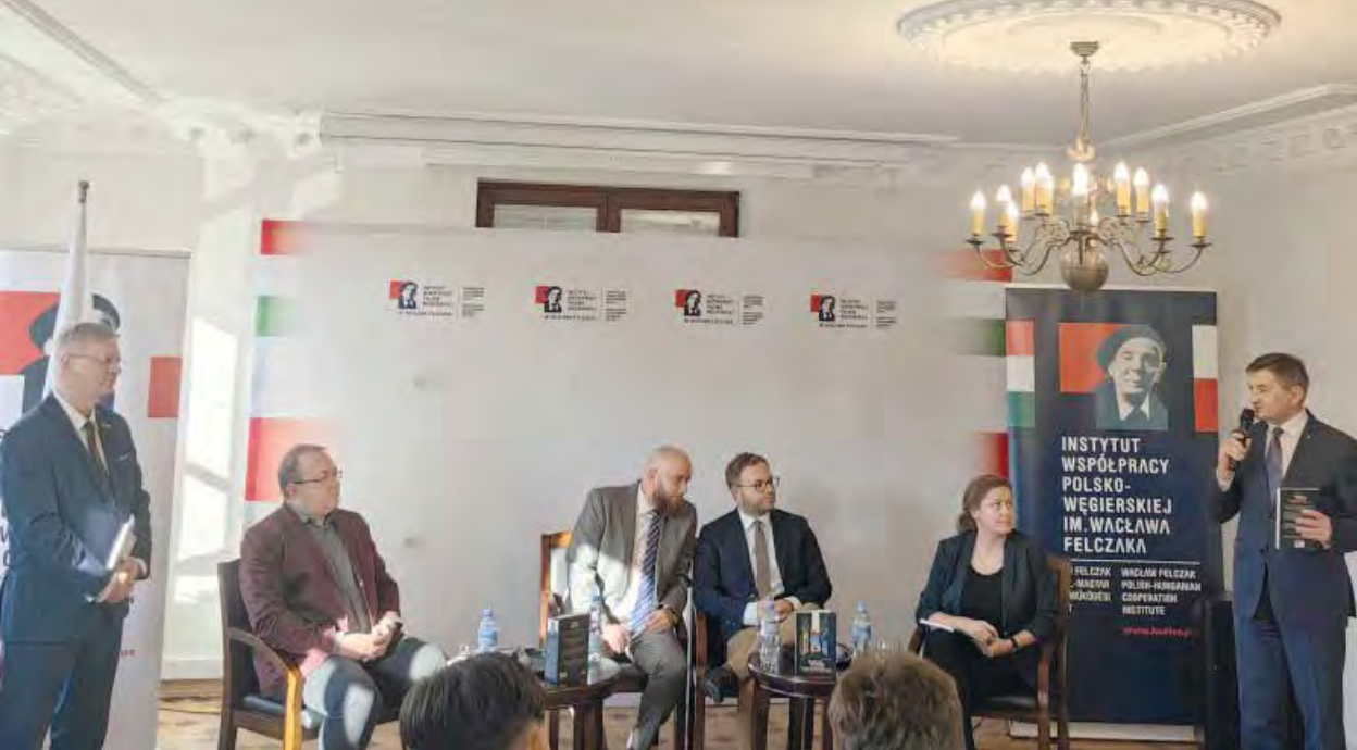
Inauguracja działalności Klubu Europy Karpat, Warszawa, 4 listopada 2022 r.

inny stosunek do USA, do Chin i do innych państw, ale elity powinny umieć wypracować jedność mimo tych różnic – dodał węgierski minister.